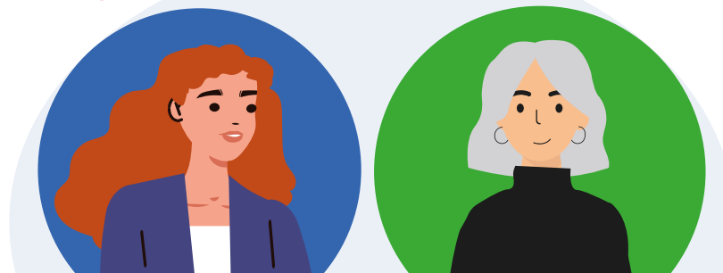
Leidinggevende & Medewerker

Tijdens verzuim werken jullie samen aan de beste aanpak voor je herstel en terugkeer naar werk.